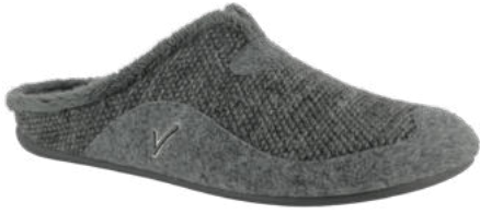
02635 Pedro lieferbar Anfang 07.2026

Weite G, Canvasmaterial, Plüschfutter, Wechselfußbett, Gummisohle