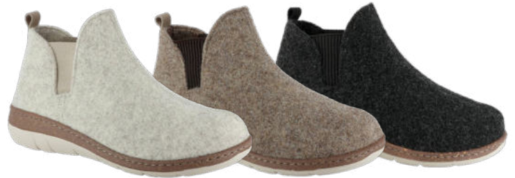
13521 Wilma lieferbar Anfang 08.2026 Weite H, Filzmaterial, Gummizüge, Wechselfußbett, PU-Sohle Farben & Größen: 30 natur, 50 braun, 60 schwarz: 36 - 42