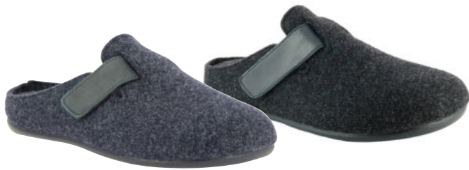
02656 Carlo lieferbar Anfang 07.2026

Weite G, Filzmaterial, Klettverschluss, Wechselfußbett, Gummisohle