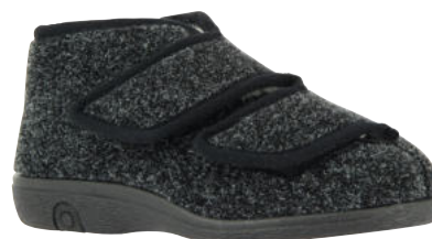
69541 Toni sofort lieferbar

Weite G, Wollstoff , Schurwollfutter, Klettverschlüsse, PVC-Sohle