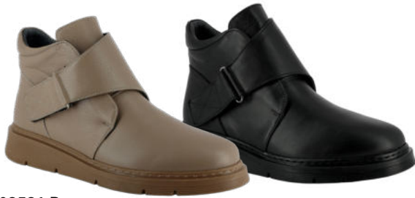
03531 Bea lieferbar Anfang 08.2026 Weite H, Leder , Textilfutter, Klettverschluss mit Umlenkschnalle, Wechselfußbett mit Lederbezug, PU-Sohle Farben & Größen: 50 tan, 60 schwarz: 36 - 42