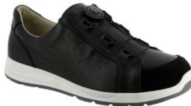
88220 Logan lieferbar Ende 08.2026 Weite K, Leder , Dialinofutter, Drehschnürverschluss, Wechselfußbett mit Dialinobezug und Memoryeffekt, PU-Sohle Farben & Größen: 60 schwarz: 7 - 12