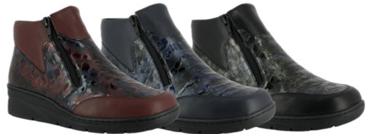
03551 Charlott lieferbar Anfang 08.2026 Weite H, Leder , Textilfutter, Doppelreißverschluss, Wechselfußbett mit Lederbezug, PU-Sohle Farben & Größen: 03 bordeaux, 25 marine, 82 khaki: 36 - 42