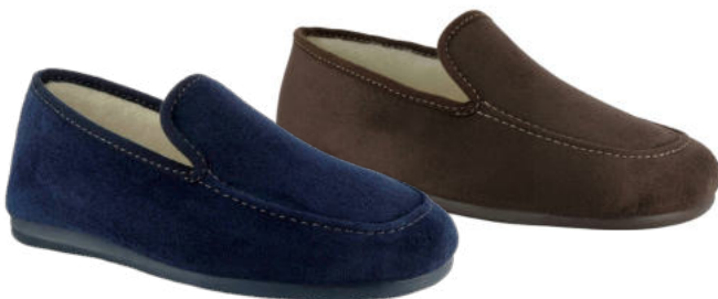
02675 Rafael lieferbar Anfang 07.2026

Weite G, Veloursmaterial, Wollfutter, Wechselfußbett, Gummisohle