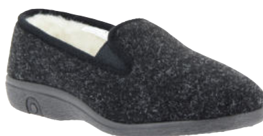
69126 Simon sofort lieferbar

Weite G, Wollstoff , Schurwollfutter, Gummizüge, PVC-Sohle