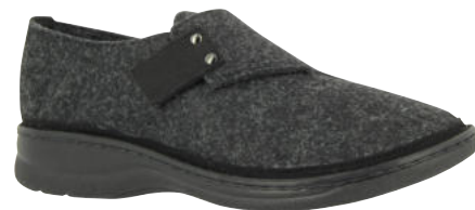
04801 Bruce lieferbar Anfang 08.2026

Weite H, Filzmaterial, Klettverschluss, Wechselfußbett, PU-Sohle