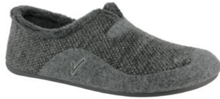
02653 Mateo lieferbar Anfang 07.2026

Weite G, Canvasmaterial, Plüschfutter, Wechselfußbett, Gummisohle