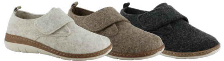
13221 Wenke lieferbar Anfang 08.2026 Weite H, Filzmaterial, Klettverschluss, Wechselfußbett, PU-Sohle Farben & Größen: 30 natur, 50 braun, 60 schwarz: 36 - 42