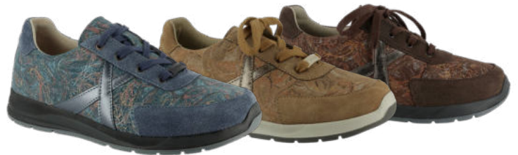
87117 Kioto Leder season lieferbar Ende 08.2026 Weite K, Leder , Dialinofutter, Reißverschluss, Schnürung, Wechselfußbett mit Dialinobezug und Memoryeffekt, PU-Sohle Farben & Größen: 20 blau, 81 karamell, 54 braun: 3 - 8