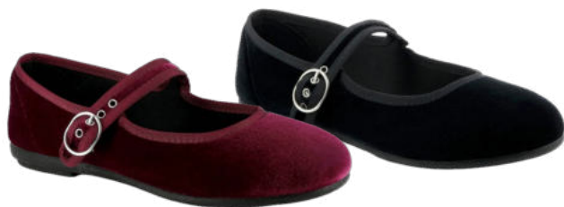
02856 Estrella lieferbar Anfang 07.2026 Weite G, Samtmaterial , Textilfutter, Gummisohle Farben & Größen: 03 bordeaux, 60 schwarz: 35 - 42