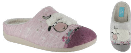
02851 Lamita lieferbar Anfang 07.2026 Weite G, Veloursmaterial , Plüschfutter, Verzierung Schaf, Wechselfußbett, Gummisohle Farben & Größen: 05 rosa, 68 hellgrau: 35 - 42