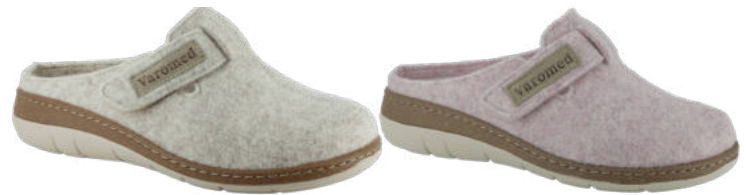
13721 Sophie lieferbar Anfang 08.2026 Weite H, Filzmaterial, Klettverschluss, Wechselfußbett, PU-Sohle Farben & Größen: 30 natur, 05 rosa, 08 beere, 17 mint, 21 hellblau: 36 - 42