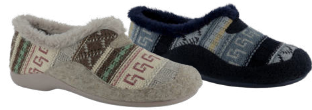
02778 Carla lieferbar Anfang 07.2026 Weite G, Strickmaterial , Plüschfutter, Wechselfußbett, Gummisohle Farben & Größen: 06 altrosa, 25 marine: 35 - 42