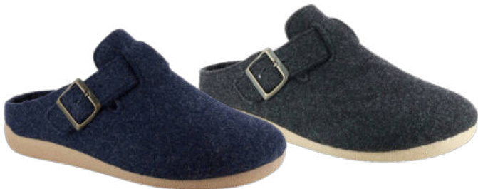
02677 Pablo lieferbar Anfang 07.2026

25 marine, 50 braun, 60 schwarz: 39 - 46