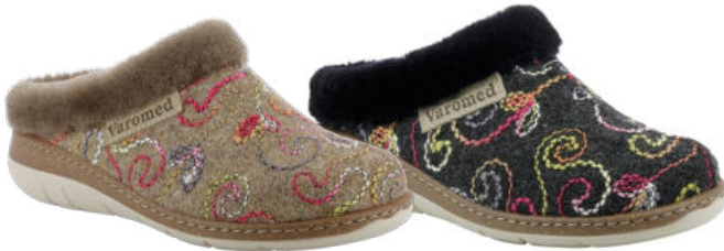
13712 Lotta lieferbar Anfang 07.2026 Weite H, Filzmaterial, Lammfellkragen, Wechselfußbett, PU-Sohle Farben & Größen: 50 braun, 60 schwarz: 36 - 42