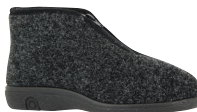
69511 Richard sofort lieferbar

Weite G, Wollstoff , Schurwollfutter, Reißverschluss, PVC-Sohle