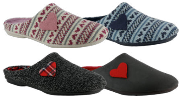
02748 Tinka lieferbar Anfang 07.2026 Weite G, Textilmaterial , Textilfutter, Wechselfußbett, Gummisohle Farben & Größen: 05 rosa, 21 hellblau, 60 schwarz, 63 dunkelgrau: 35 - 42