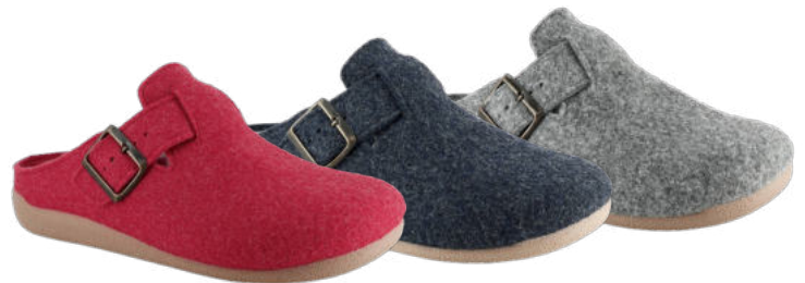
02800 Adalie lieferbar Anfang 07.2026 Weite G, Filzmaterial recycelt , verstellbarer Seitenriemen, Wechselfußbett, Gummisohle Farben & Größen: 01 rot, 25 marine, 68 hellgrau: 35 - 42