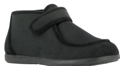
02667 Maxi lieferbar Anfang 07.2026

Weite G, Effektstoff , Stretcheinsatz, Plüschfutter, Klettverschluss, Wechselfußbett, Gummisohle