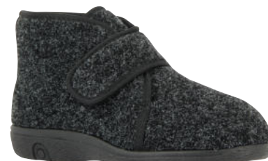
69531 Rudi sofort lieferbar

Weite G, Wollstoff , Schurwollfutter, Klettverschluss, PVC-Sohle