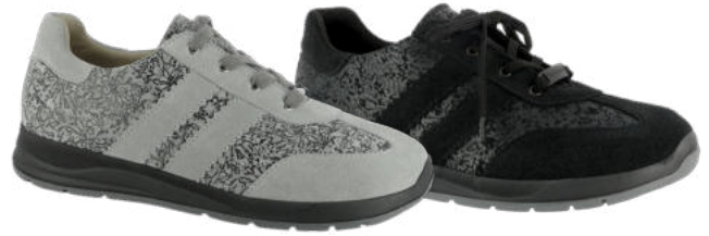
87301 Soho lieferbar Anfang 08.2026 Weite K, Leder , Dialinofutter, Reißverschluss, Schnürung, Wechselfußbett mit Dialinobezug und Memoryeffekt, PU-Sohle Farben & Größen: 60 schwarz, 68 hellgrau: 3 - 8