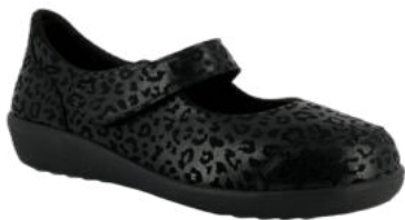
77705 Sevilla Leder season lieferbar Ende 08.2026 Weite K, Leder , Dialinofutter, Klettverschluss, Weichschaumfußbett mit Cool-Max-Bezug, PU/TPU-Sohle Farben & Größen: 60 schwarz: 3 - 8