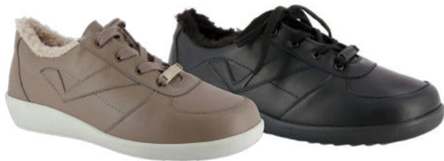
77161 Monti lieferbar Ende 08.2026 Weite K, Leder , Teddyfutter, Reißverschluss sowie Zierschnürung, Weichschaumfußbett mit Teddyfutterbezug, PU/TPU-Sohle Farben & Größen: 50 tan, 60 schwarz: 3 - 8