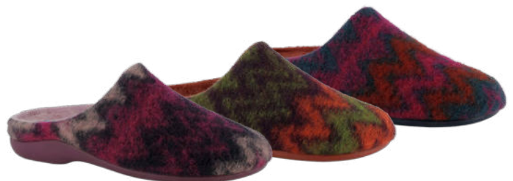
02861 Maja lieferbar Anfang 07.2026 Weite G, Filzmaterial , Plüschfutter, Wechselfußbett, Gummisohle Farben & Größen: 087 brombeere-malve, 121 khaki-ziegelrot, 252 marine-ziegelrot: 35 - 42