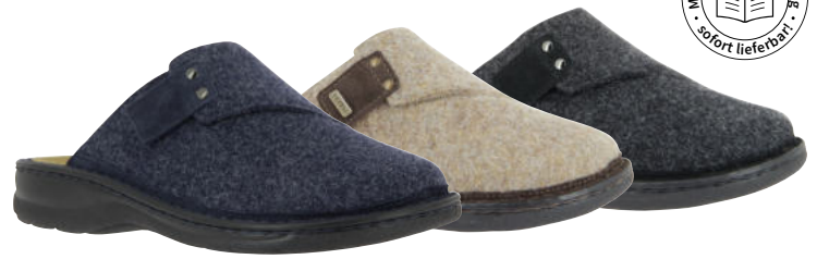
04871 Henry lieferbar Anfang 08.2026

Weite H, Filzmaterial, Klettverschluss, Wechselfußbett, PU-Sohle