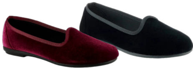
02855 Lucinda lieferbar Anfang 07.2026 Weite G, Samtmaterial , Textilfutter, Gummisohle Farben & Größen: 03 bordeaux, 60 schwarz: 35 - 42