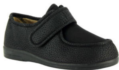
02626 Ronaldo lieferbar Anfang 07.2026

Weite K, Effektstoff , Stretcheinsatz, Plüschfutter, Klettverschluss, Wechselfußbett, Gummisohle