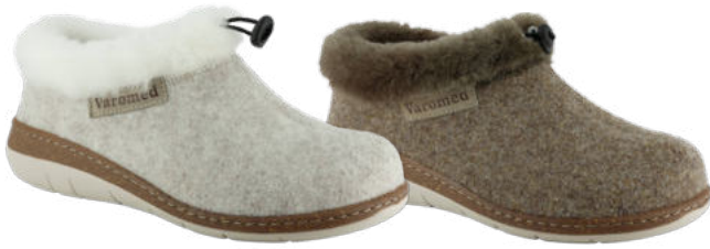
13211 Cleo lieferbar Anfang 08.2026 Weite H, Filzmaterial, Lammfell-Kragen, Wechselfußbett, PU-Sohle Farben & Größen: 30 natur, 50 braun: 36 - 42