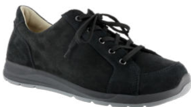
88211 Bronx lieferbar Ende 08.2026 Weite K, Leder , Dialinofutter, Schnürung, Wechselfußbett Dialinobezug und Memoryeffekt, PU-Sohle Farben & Größen: 60 schwarz: 7 - 12