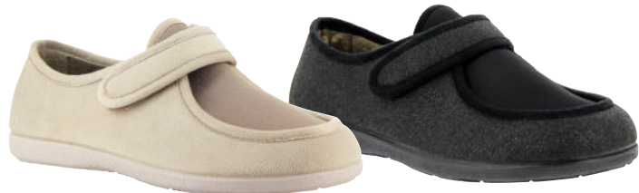
02624 Ricardo lieferbar Anfang 07.2026

Weite G, Effektstoff , Stretcheinsatz, Plüschfutter, Klettverschluss, Wechselfußbett, Gummisohle