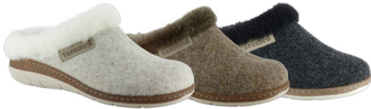
13711 Leni lieferbar Anfang 08.2026 Weite H, Filzmaterial, Lammfell-Kragen, Wechselfußbett, PU-Sohle Farben & Größen: 30 natur, 50 braun, 60 schwarz: 36 - 42