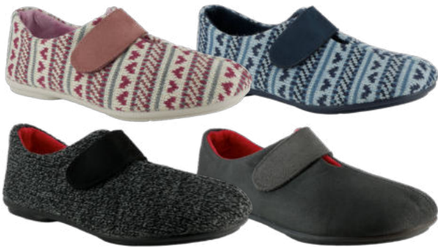
02743 Binti lieferbar Anfang 07.2026 Weite G, Textilmaterial , Textilfutter, Klettverschluss, Wechselfußbett, Gummisohle Farben & Größen: 05 rosa, 21 hellblau, 63 dunkelgrau, 60 schwarz: 35 - 42